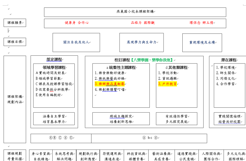
圖2燕巢國小校本課程架構-八樂學園與戶外教育