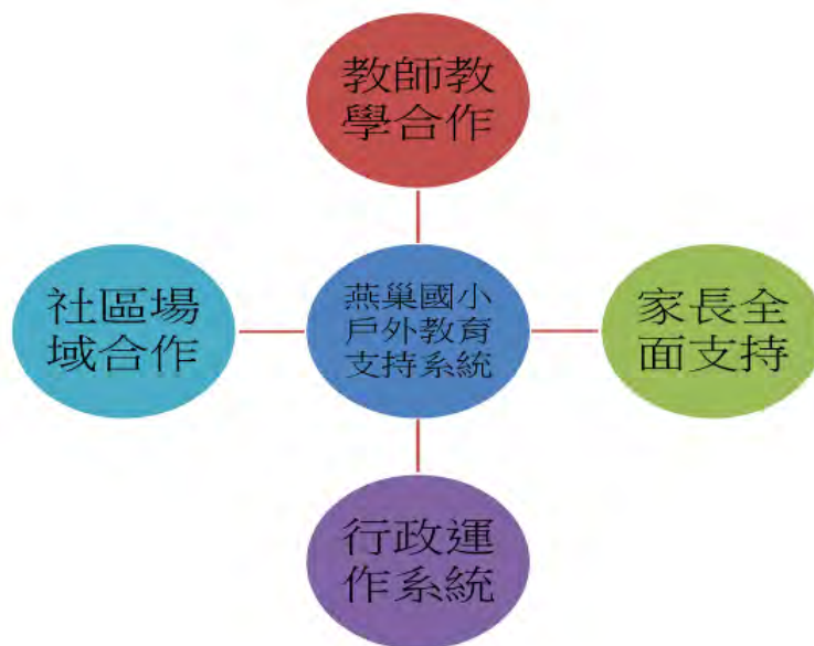
圖：燕巢國小戶外教育支持系統圖