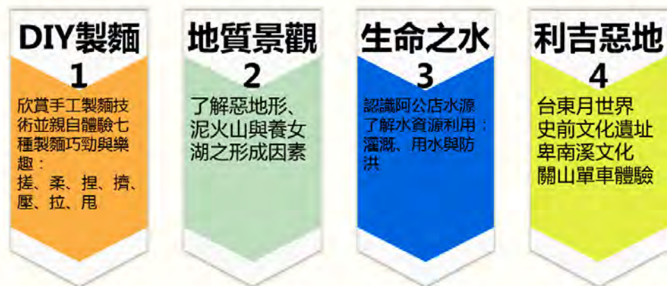
圖3燕巢國小優質戶外教育路線圖

燕巢有什麼好玩的？燕巢有什麼能學的？玩、樂趣、沒有壓力以及不需反覆背誦是學生們最渴望的學習樣貌，透過戶外教育課程，讓學生感受到學習的樂取所在，但是大自然能教會學生什麼？燕巢國小創造不一樣的教育機會，讓學生透過 室內教學+自然+生態+美景+DIY=燕巢深度學習體驗之旅 ，本次計畫除了燕巢在地課程以外，更將學生帶往台東，探訪同為惡地質的生態，讓學生更了解地質的奧秘。